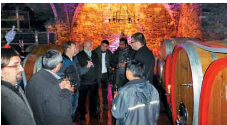
Kletar nam je govoril o škofijskih vinogradih in kletarjenju.