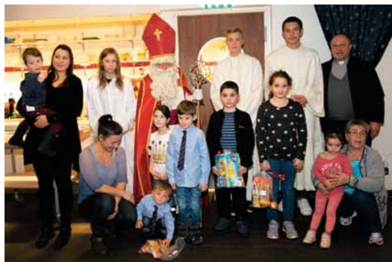
Tudi sv. Miklavž se je rad pridružil skupinski fotografiji v Göteborgu