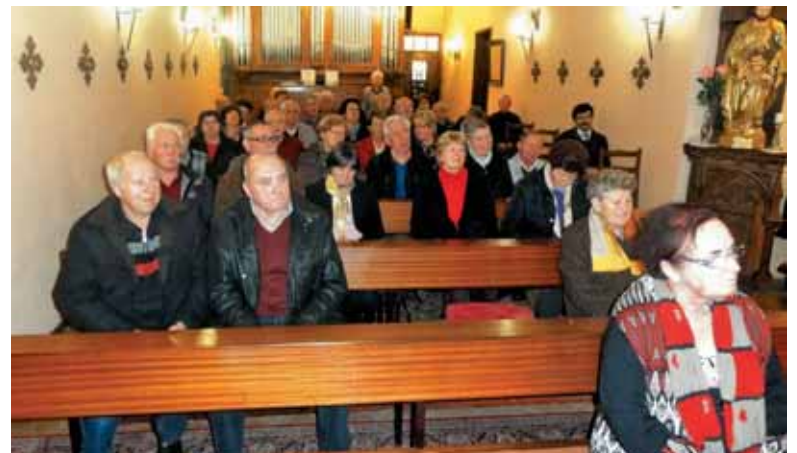
V kapeli v Merlebachu