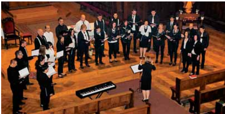
Zbor iz Tolmina