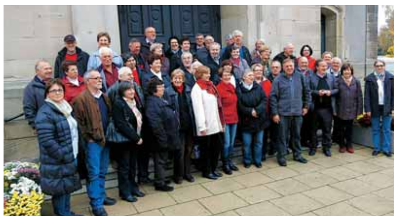
Prijatelji iz Stuttgarta in okolice na enodnevem obisku v Merlebachu in Saint-Avoldu