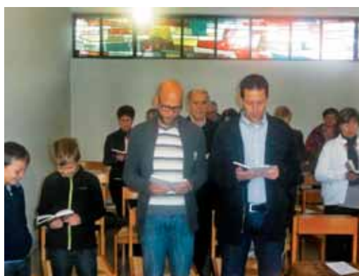
Naši verniki v Schorndorfu