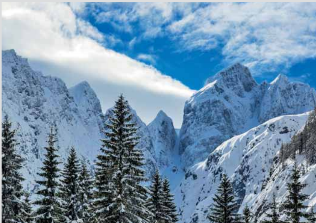
Tamar, foto: Klemen Kunaver