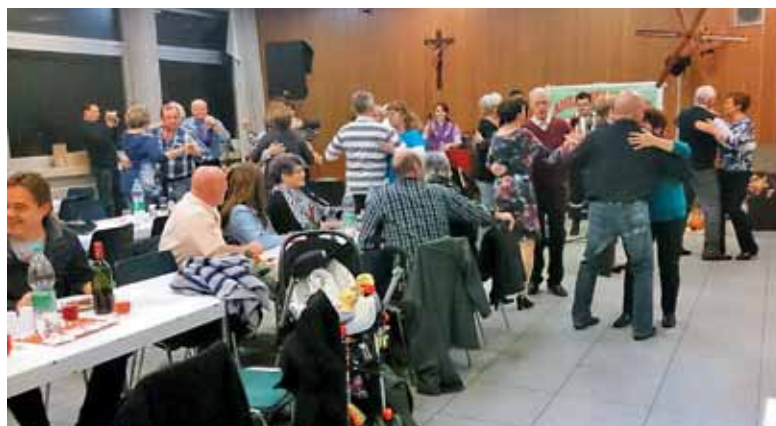
Udeleženci martinovanja so zaplesali ob zvokih »Žerjava« iz Artič.