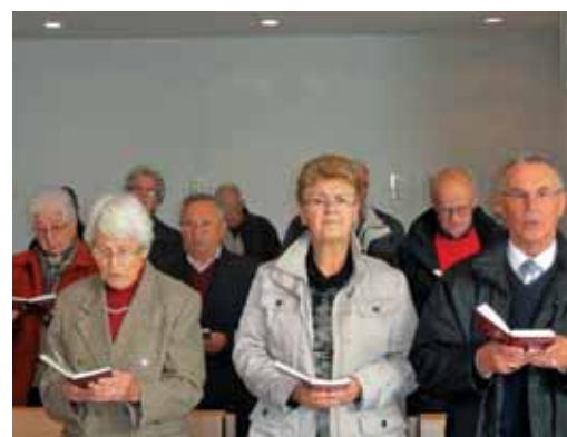
Verniki v Schwäbisch Gmündu