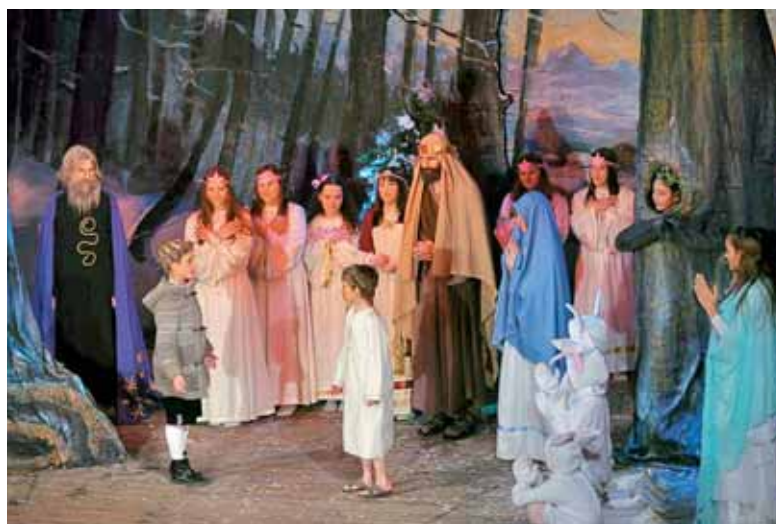
Alojzijeva proslava, otroci in mladina pri igri »Petrickove poslednje sanje«