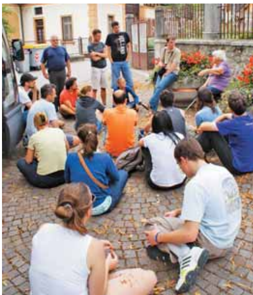
Prijeten pogovor v Žabnicah

Kdor se je opredelil za Nemčijo, je pomenilo, da se bo seveda moral izseliti v Avstrijo. Najrevnejši domačini iz Kanalske doline so prvi odšli in se jim je to