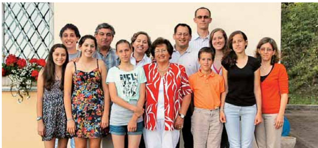
Z otroki, zetoma, vnukinjami in vnukoma

Vsem bralcem pa pošiljam prav lep pozdrav in se zahvaljujem urednikom Naše luči in sodelavcem Rafaelov družbe za vse njihovo delo, ki povezuje Slovence po svetu!