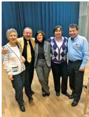
Hrvaško-slovensko prijateljstvo v naši župniji