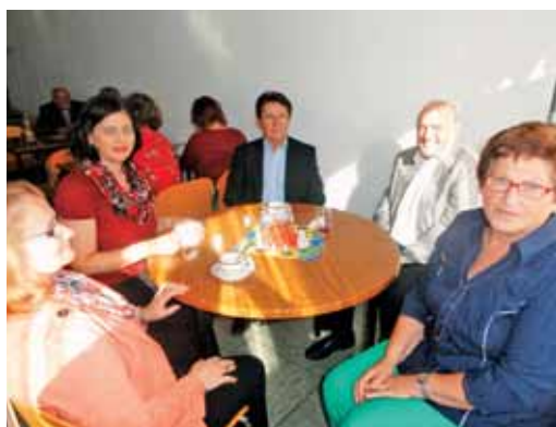
Naši verniki v Oberstenfeldu