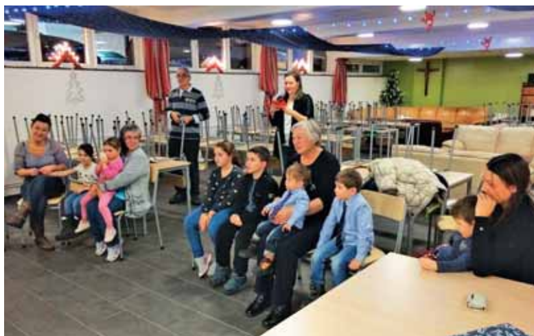
Otroci skupaj s starši in stariimi starši pričakujejo sv. Miklavža