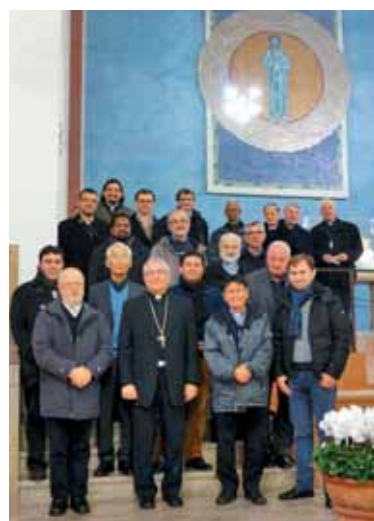
Ob grobu sv. Hildegarde v Eibingenu