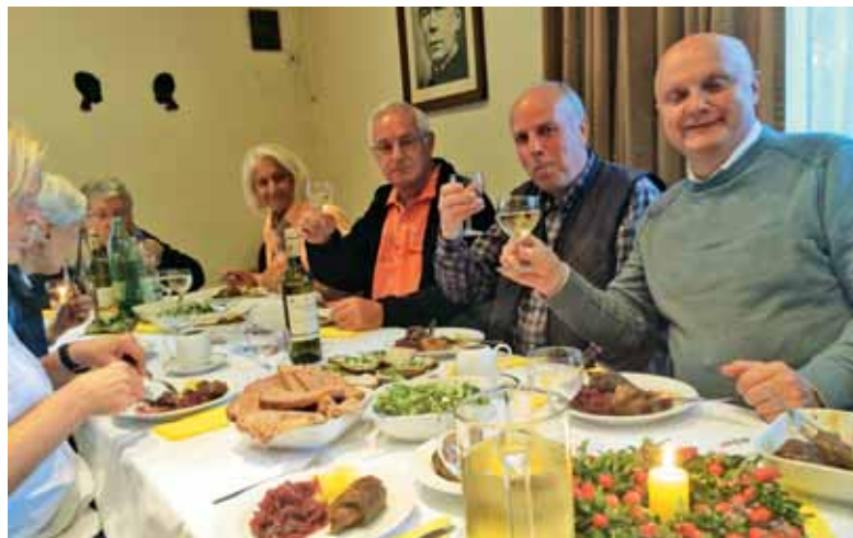
Po maši pri bogato obloženi mizi