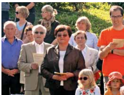
Frančiškova maša v Esslingenu