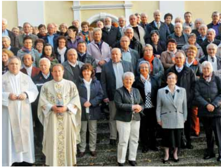
Romanje k Ave Mariji

Že tradicionalno se vsako leto v mesecu novembru zbiramo na bibličnem seminarju v Nonnenhornu, kjer cel vikend odkrivamo bogastvo Svetega pisma in razmišljamo o zgodovini odrešenja, ki ga je za izvoljeno judovsko ljudstvo pripravil skrivnostni in vsemogočni Bog. Letošnje leto so bili glavna tema štirje evangeliji, ki so jih napisali evangelisti Matej, Marko, Luka in Janez. Duhovno bogastvo, ki ga prinašajo štirje evangeliji, je za nas kristjane kot vsakodnevna hrana, ki nas hrani in opogumlja skozi pasti in prepreke življenja. Poleg štirih evangelijev smo spoznali tudi vpliv krščanstva na razvoj umetnosti, slikarstva in kiparstva. Božja beseda je res ostrejša kakor vsak dvorezen meč in se kristjana dotakne v najbolj globokih predelih srca in duše. Zato je še kako pomembno, da kristjan prebira to