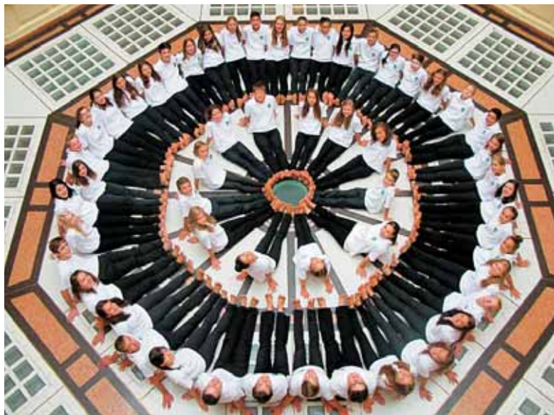
Nastop pevskega zbora HIB-art Liebenau

s svojim adventnim koncertom v našem partnerskem mestu Mariboru. Ta pevski zbor je nastopal že po celem svetu in požel neštete prve nagrade, zato smo ponosni, da bodo sedaj »prvič« nastopili v Mariboru.