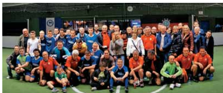
Trhle veje in naš Klub SKV Berlin