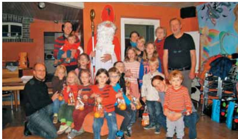
Otroci iz Luksemburga so se razveselili svetega Miklavža.