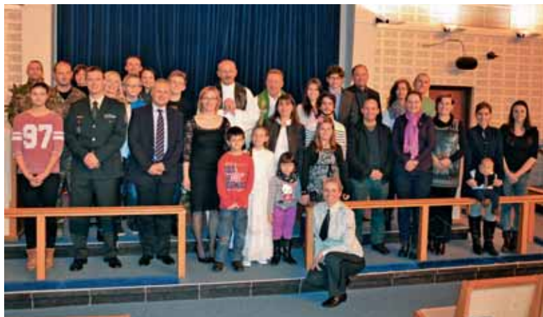
Slovinci v kapeli baze Nato v Monsu