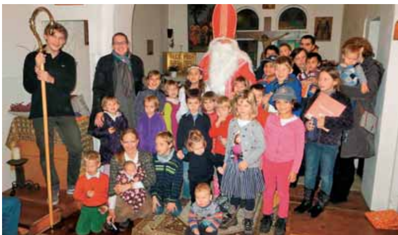
Veselje ob prihodu sv. Miklavža v Bruslju.

tudi s prijetnimi glasbenimi vložki. Igrica, ki je trajala kakšne pol ure, je tako pritegnila navzoče otroke, da jih je dobesedno »potegnila vase«. Poplačan je bil trud dobrega meseca in pol, ko so starši v obliki elektronske klepetalnice razmišljali o pou-