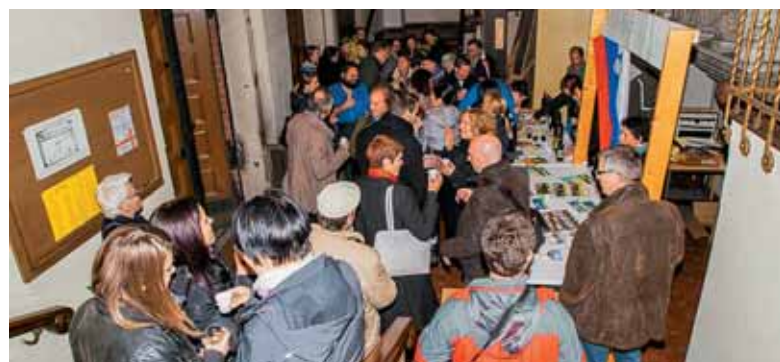
Pogostitev, ki so jo pripravili Tolminčani.