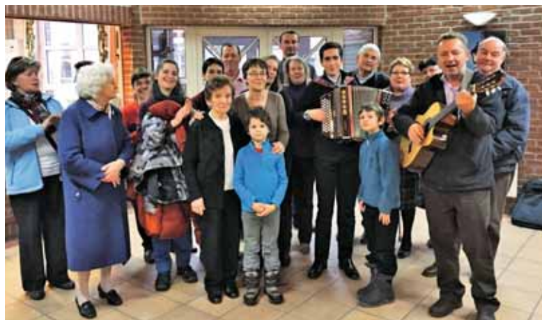
Boussu pri Monsu, na Miklavževo nedeljo nas je po maši družilo še veselo adventno pričakovanje.