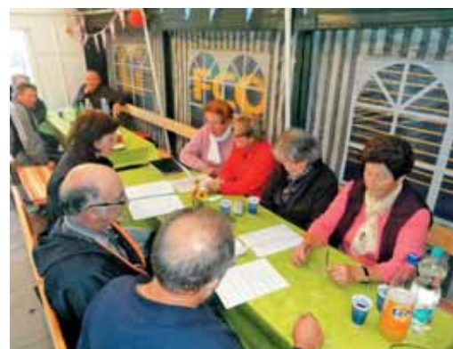
Vaje pevskega zbora Obzorje