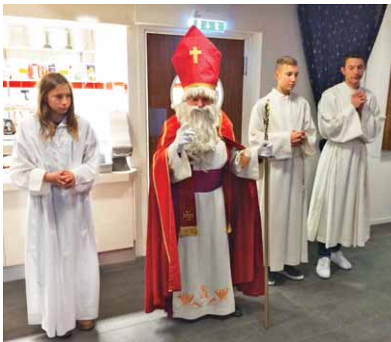
Sv. Miklavž, skupaj z angeli, je obiskal otroke v Göteborgu.