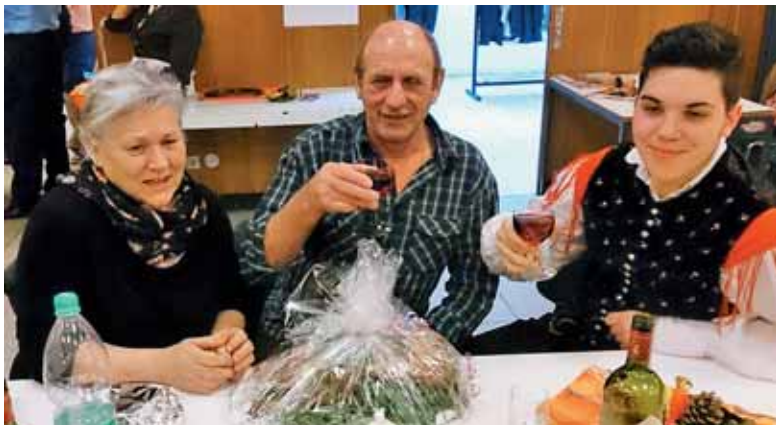
Pečeni gosi je vredno nazdraviti.