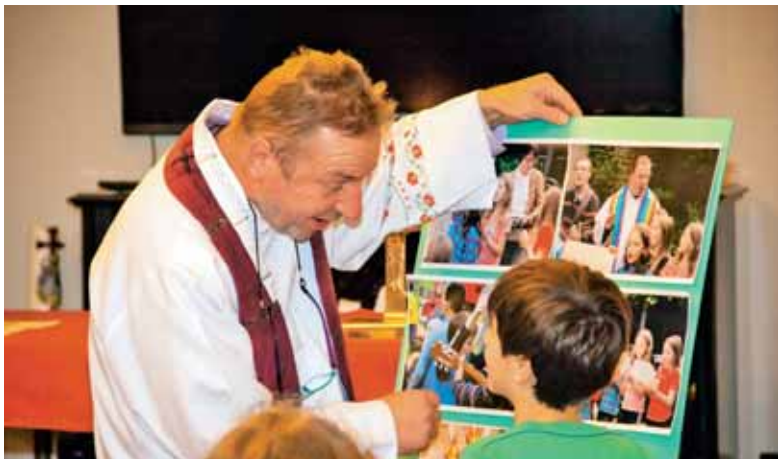
Dialogirana pridiga z otroki v Haagu na Miklavžev večer.