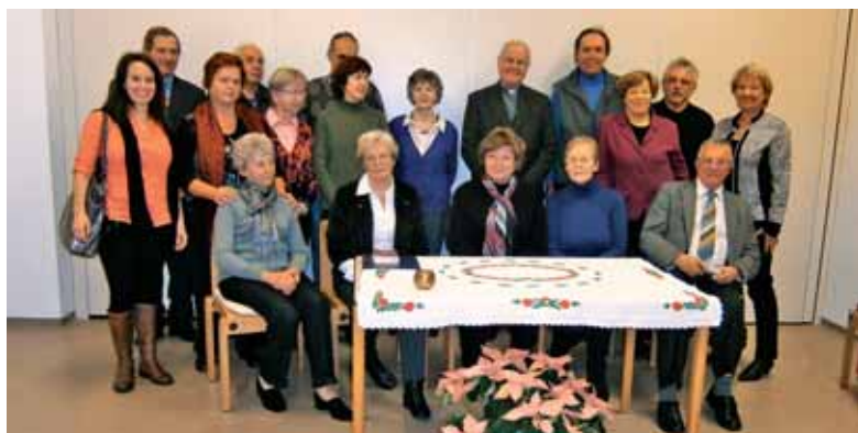
Udeleženci adventne duhovne obnove