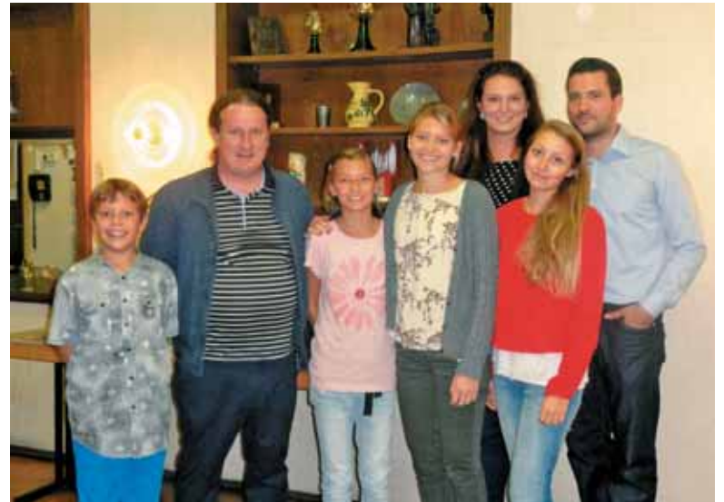
Naš mladi rod v Heilbronn

Vsako leto ob prvem novembru imamo verniki iz župnije Stuttgart in Augsburg tradicionalno romanje k Ave Mariji v Deggingen, kjer se s sveto mašo in litanijami na čast Materi božji in pred izpostavljenim Najsvejšim spomnimo vseh naših rajnih sorodnikov, prijateljev in znancev, ki so že prestopili prag upanja in uživajo nebeško srečo v družbi angelov in svetnikov. Vsako leto se tega romanja udeleži lepo število naših ljudi, ki ostanejo tukaj v Nemčiji in tukaj opravijo spokorno dejanje spomina na svoje najdražje, ki počivajo doma v Sloveniji. Spoštljivi spomin na naše rajne, ki so zaznamovali naše življenje in pri nas pustili lep pečat, je pokazatelj naše duhovne povezanosti in kulture človeka, ki o pokojnih govori samo lepo, kajti edini sodnik