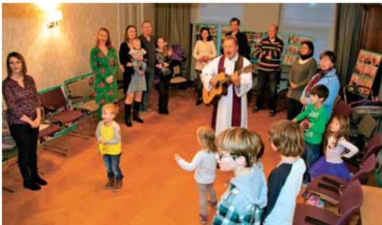
Ob prihodu sv. Miklavža smo se v Haagu na Nizozemskem s pesmijo zahvalili Gospodu.