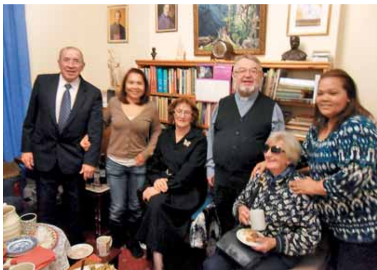
Pogostitev udeležencev slovenske sv. maše novembra v Našem domu

Še pred prvo adventno nedeljo je londonski župnik začel razpošiljati svoja Bogoslužna sporočila za