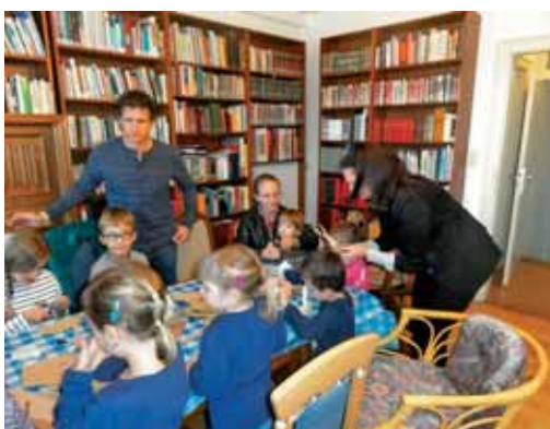
V sobotni šoli in pri verouku