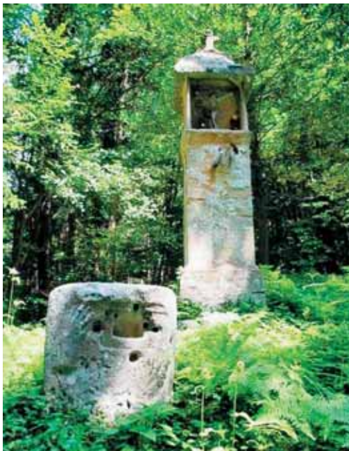
Znamenje v Laškem iz 16. stoletja

Med vsemi so nedvomno najštevilnejša lesena razpela, postavljena na javnih krajih. Križ sam kot nosilec Kristusovega telesa je navadno preprost in se zato krasilni nagibi največkrat izražajo v strešici, ki pokriva izklesani ali naslikani korpus. O času nastanka obstoječih razpel pa bi lahko rekli, da so vsi iz zadnjih desetletij, saj zaradi izpostavljenosti