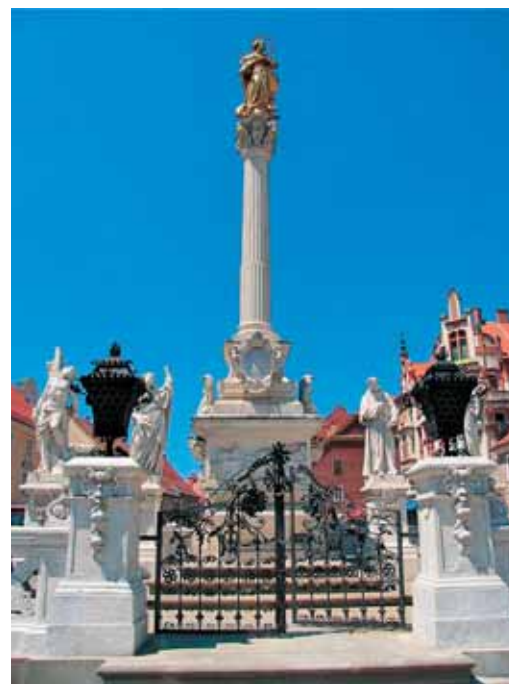
Kužno znamenje v Mariboru

Druga tema pri upodobitvah se nanaša na Marijo, bodisi poslikano bodisi v obliki navadnega