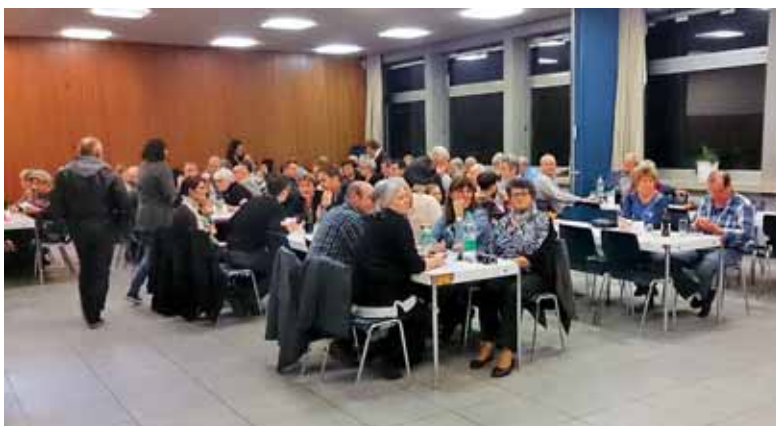
Del letošnjih obiskovalcev našega martinovanja