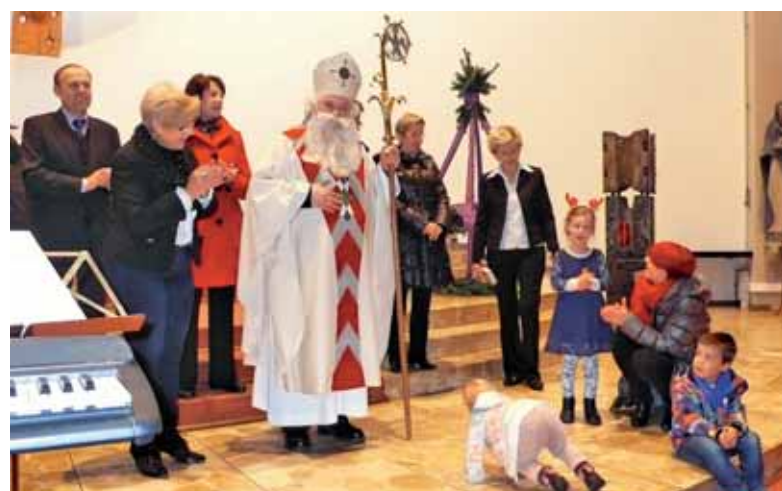
Miklavž v Ulmu