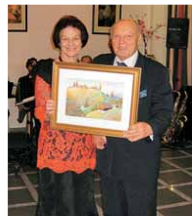
Dražba slike za otroško vas v Stübingu