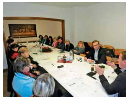
Sestanek župnijskega pastoralnega sveta