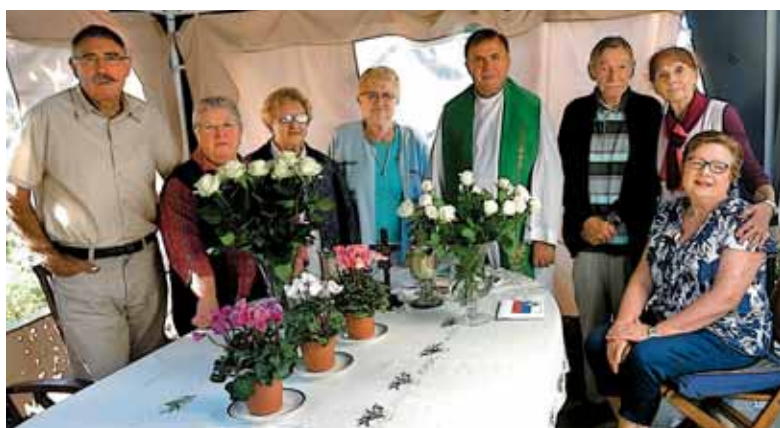
Utrinek iz delegatskega pastoralnega obiska 1. oktobra v Châteauneuf-sur-Loire