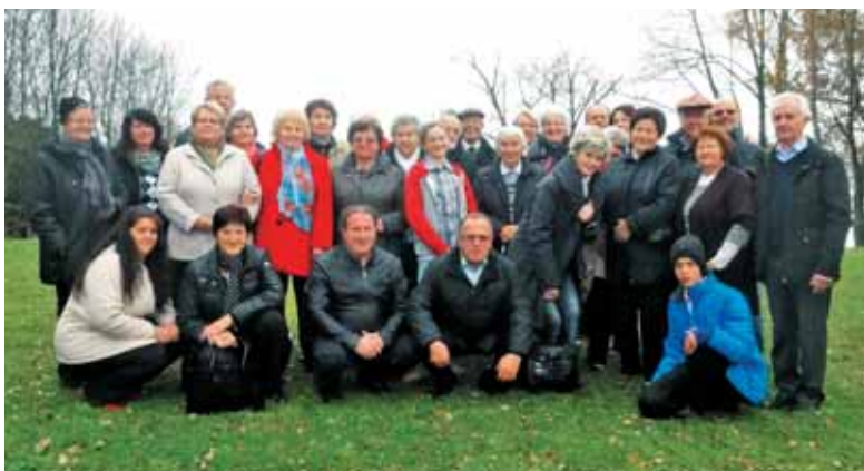
Biblični seminar 2014

sko pesem. Pot nas je nato vodila do ameriškega pokopališča, kjer počiva in čaka dan vstajenja 11000 ameriških vojakov, ki so svoje življenje podarili svobodi izpod nacizma v drugi svetovni vojni. V vseh nas je bilo navzoče globoko spoštovanje do teh vojakov, ki so tudi za našo svobodo dali svoje največje darilo, to je dar življenja. Tako lepo urejena pokopališča z vsemi temi belimi križi ali z Davidovimi zvezdami ne srečamo na vsakem koraku. In na koncu smo se ponovno zaustavili v prostorih slovenske misije, še na kavici in pecivu, ter se nato zadovoljni