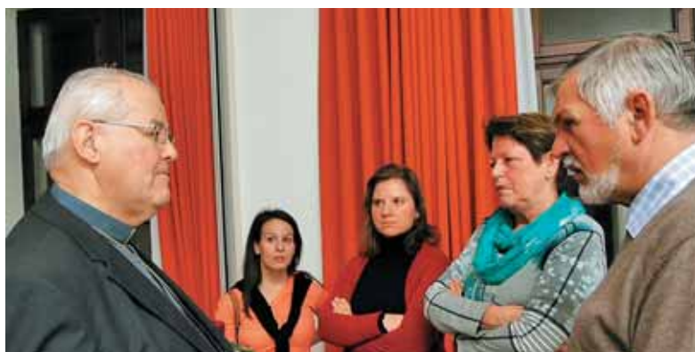
Vedno zaželen sogovornik, škof Metod