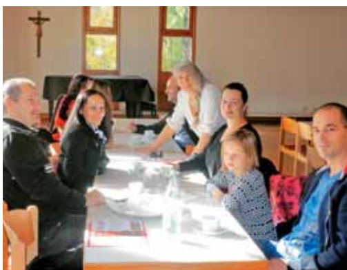
Srečanje po sveti maši v Böblingenu