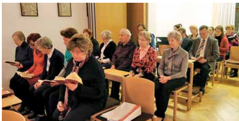
Sklep duhovne obnove pri zahvalni sv. maši