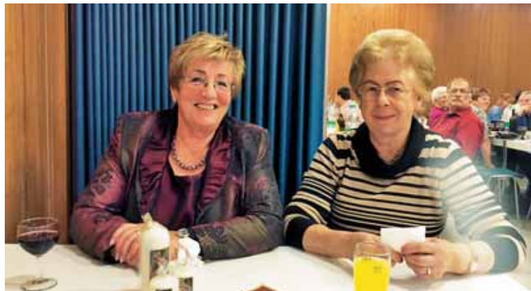
Mladenki sta sprejemali obiskovalce martinovanja.