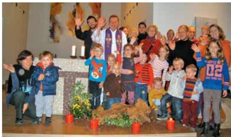
Tako smo ob prvi adventni svečki v Luksemburgu pomahali Jezusu, ki prihaja.