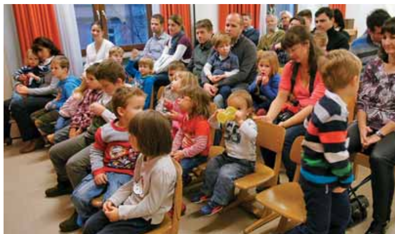
Starši so pripeljali svoje otročiče k sv. Miklavžu.

Miklavževanje. V soboto, 6. decembra, na god svetega Miklavža, smo imeli v naši skupnosti praznično slovesnost ob njegovem godu. Starši so prijaviili nekaj nad 20 otrok za sprejem in obdarovanje. Godovanje svetnika dobrote do bližnjega smo začeli v kapeli slovenskega župnijskega doma, kjer smo priporočili