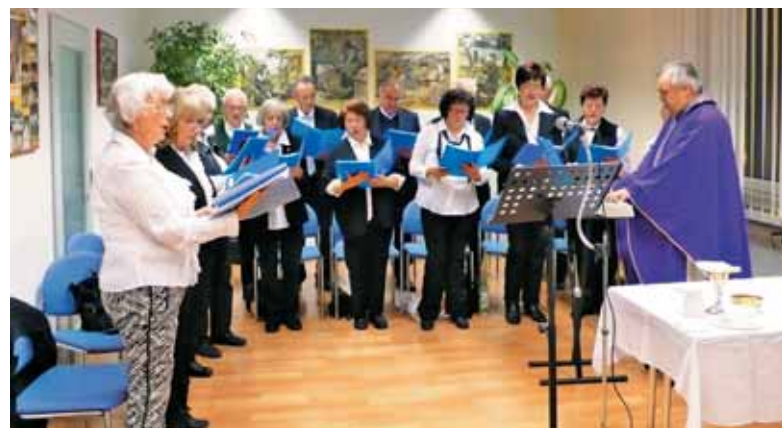
Zbor je v Augsburgu pel pri maši in po maši pred prihodom Miklavža.

organizira ponedeljkove nadvse lepe izlete.